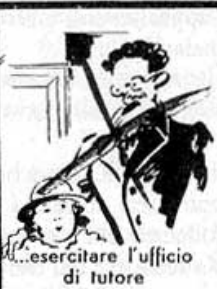
...esercitare l'ufficio di tutore