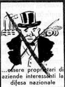
...essere proprietari di aziende interessanti la difesa nazionale