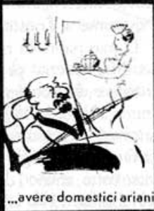
...avere domestici ariani