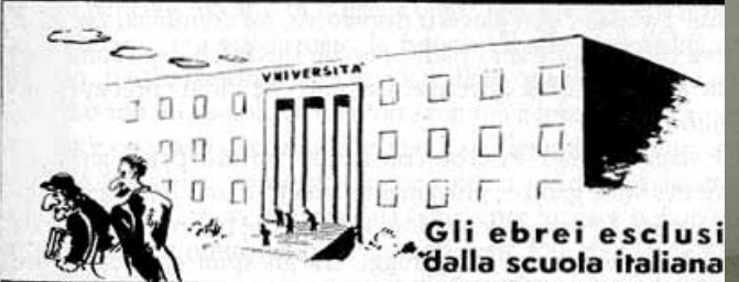
Gli ebrei esclusi dalla scuola italiana