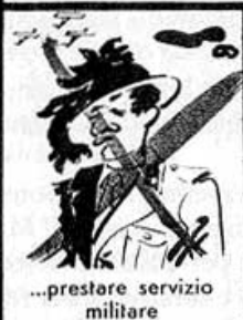
...prestare servizio militare