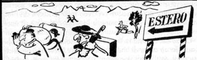
Espulsione degli ebrei stranieri