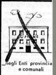
...negli Enti provinciali e comunali