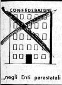
...negli Enti parastatali