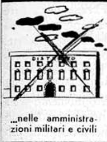
...nelle amministrazioni militari e civili